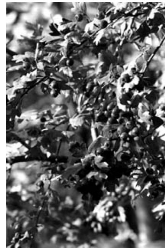
Hagtorn om hösten