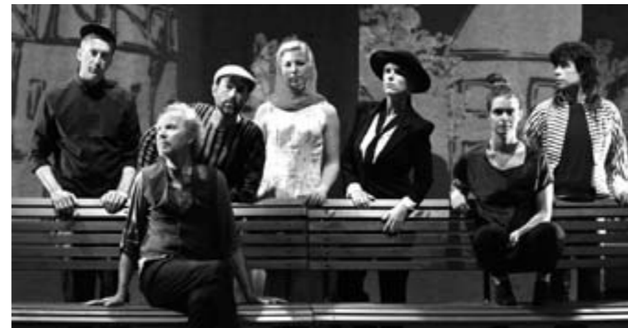
Ensemblen i Nyoperan Familjen

Ett gäng seniorpsykologer såg tillsammans nyoperaföreställningen FAMILJEN på teater Atalante i Göteborg.