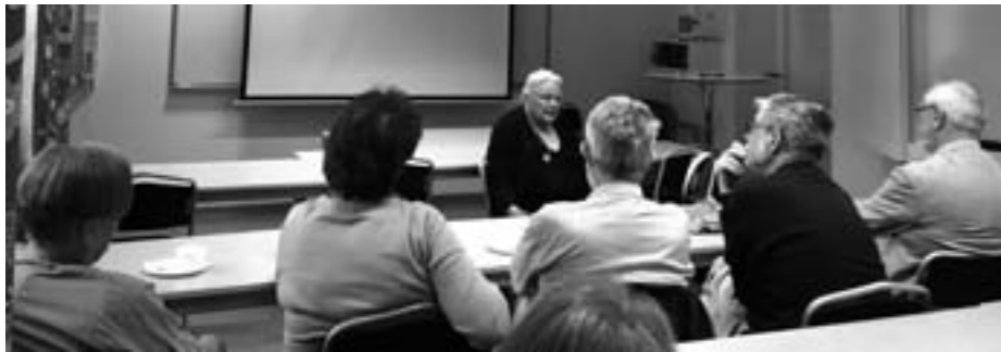
Ett yrkesliv som skolpsykolog