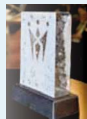
Förutom 100 000 kronor får pristagaren en glasstatyett.