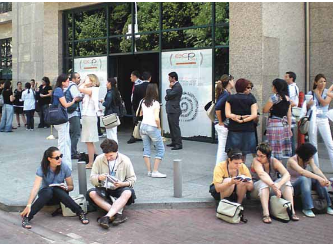
Intresset var stort, inte minst hos studenter från hela världen, när den europeiska kongressen drog igång i ett soligt Istanbul.