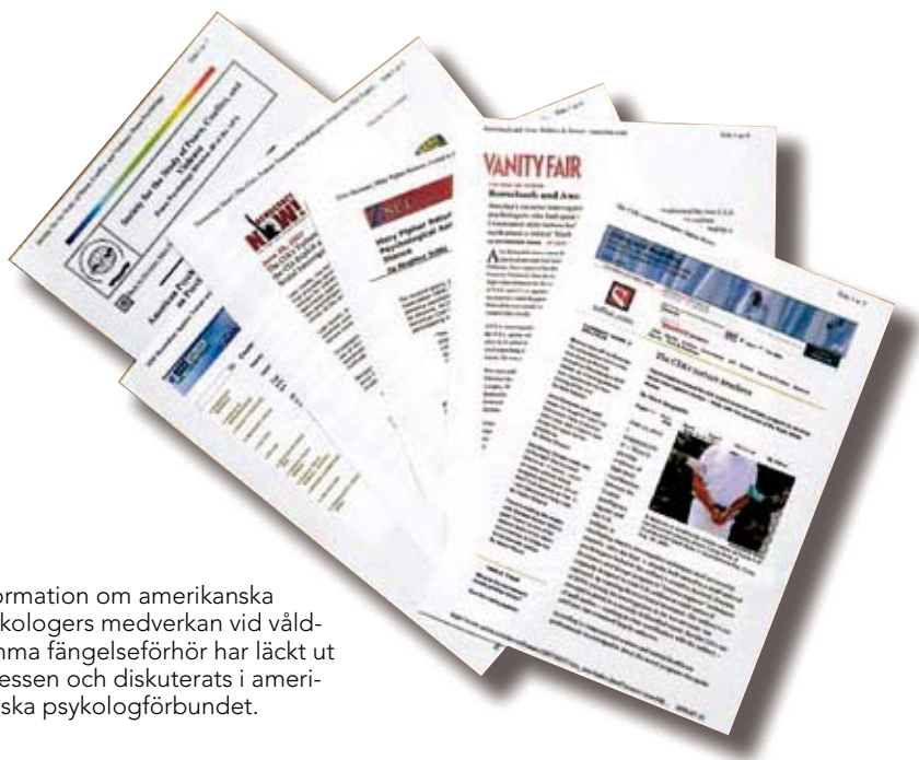
Information om amerikanska psykologers medverkan vid våldsamma fängelseförhör har läckt ut i pressen och diskuterats i amerikanska psykologförbundet.

gade förhören vid CIAs svarta ställen och på Guantánamo”, och fortsätter: ”Psykologernas sätt att arbeta vid dessa förstärkta förhörsteam bryter mot våra egna etiska regler från 2002 i vilka vi förbinder oss att respektera alla människors värdighet och värde, med särskilda skyldigheter mot de mest utsatta. Jag anser att fångar i hemliga CIA-ledda enheter utan rätt till habeas corpus eller juridiskt ombud, familj eller medier är ytterst sårbara. Jag anser också att när någon av oss förnedras, förnedras allt mänskligt liv.” (3)