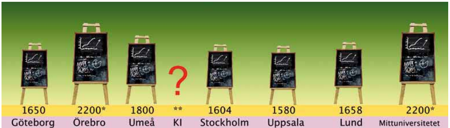
Tabell 2) Antal undervisningstimmar per student under hela Psykologprogrammet

*Siffrorna är approximativt beräknade utifrån att studierektorerna angav en riktlinje om 10-12 timmar per vecka.