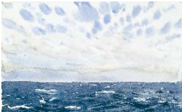
Havsstudie 1890-96. Anders Zorn.