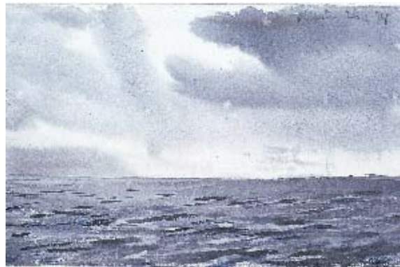
Atlanten. Anders Zorn. Zornsamlingarna, Mora.