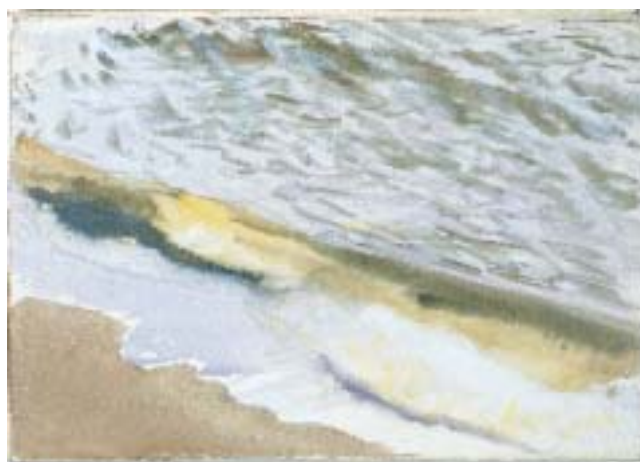
Vattenstudie, Folkstone, 1890. Akvarell Zorn. Zornsamlingarna i Mora. Havsdyningen, lika förföriskt vacker som Rosita Mauri i sin dörröppning.

Upplevelsen av skam, inte ha rätt att existera, vara utlämnad till andra och beroende får en motvikt. Det egna skapandet gör det möjligt att själv tillfredsställa behov, sörja för sig