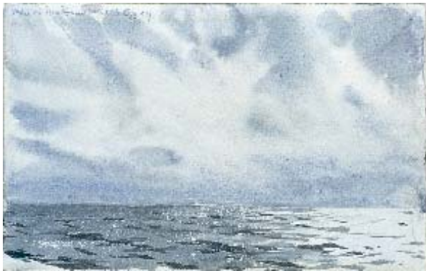
Havsstudie 1894, Anders Zorn. Zornsamlingarna, Mora.

Dalaröbilderna rör vid det självbiografiska och spontana. Är det därför Zorn skriver det "var en skapareglädjens sommar. Kanske den skönaste jag minns". Ligger där en parvel bakom vassruggarna och kikar fram. Är det kanske minnets kikande barnperspektiv som gör att kvinnorna ännu oftast ses snett bakifrån och med så rejäla bakdelar?