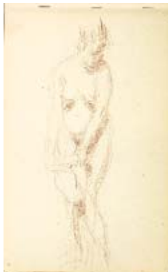
"Den sönderslagna krukans", skiss, brun krita 1920. Anders Zorn. Zornsamlingarna, Mora. Skissen till Zorns allra sista konstverk.

Den 22 augusti avlider Anders Zorn. Livets vatten har runnit ut.