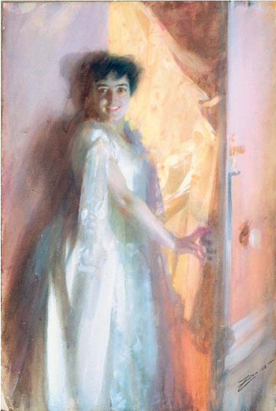
Rosita Mauri. 1888. Akvarell Zorn. Balettdansösen möter oss lika varm och leende som havets gyllne kvällsdyning.

starten, nyekiperad och med sin nya identitet – Leonard Zorn.