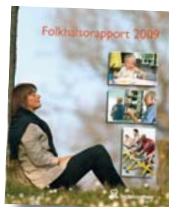
Folkhälso- rapport 2009

NEDSATT PSYKISKT välbefinnande ökar i samtliga ungdomsgrupper. I Folkhälso rapporten poängteras att ungdomars livsvillkor i