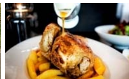
Marockos flytande guld