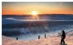
Snöröj - Åre backstage