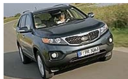
Testet: Kia Sorento