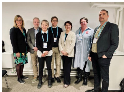
Panelen "Så kan primärvården klara sitt uppdrag som första linjens psykiatri" på Vårdarenan.

första linjens psykiatri. Förbundet har också dialog med Socialstyrelsen angående uppdraget att stödja regioner och kommuner i utmönstring av vård med ingen eller begränsad nytta.